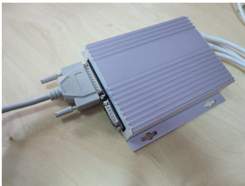
Рисунок 3. Подключение интерфейсного кабеля к контроллеру станка

На рисунке 3 показано подключение интерфейсного кабеля к контроллеру станка.