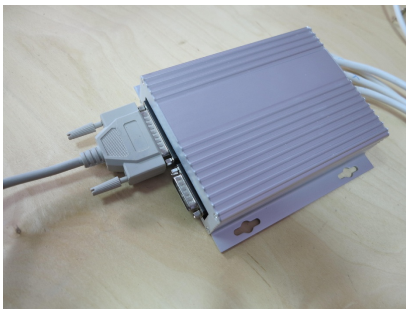
Рисунок 3. Подключение интерфейсного кабеля к контроллеру станка

На рисунке 3 показано подключение интерфейсного кабеля к контроллеру станка.